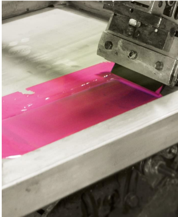
Disolvente de limpieza para todas las familias de tintas y barnices, de base disolvente o vegetal

iBiotec® Tec Industries®Service Z.I La Massane - 13210 Saint-Rémy de Provence – France Tél. +33(0)4 90 92 74 70 – Fax. +33 (0)4 90 92 32 32 www.ibiotec.fr